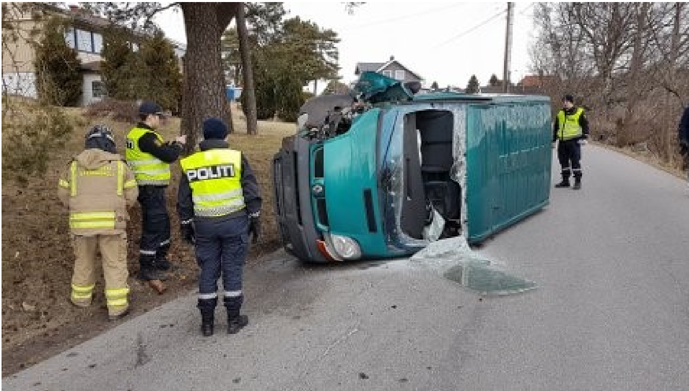
Varebil veltet på Torp