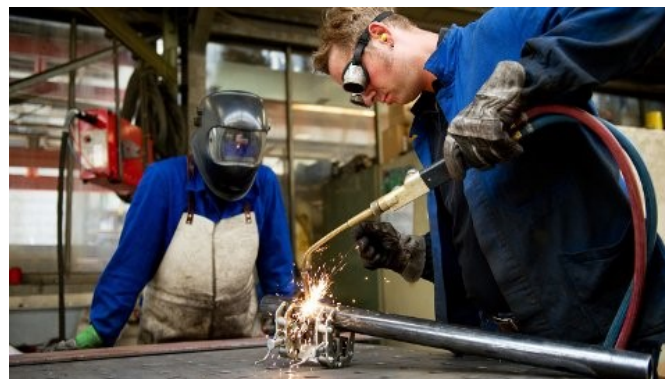
Nå kan du ta fagbrev på jobben - og få full lønn